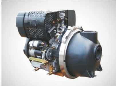
SW 1000 mit Dieselmotor