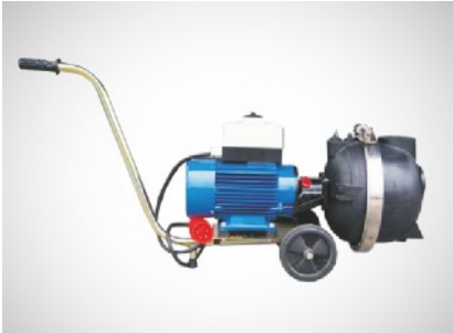
SW 1000 mit E-Motor auf Transportwagen

stark verschmutzte Medien - jetzt auch für Flüssigdünger